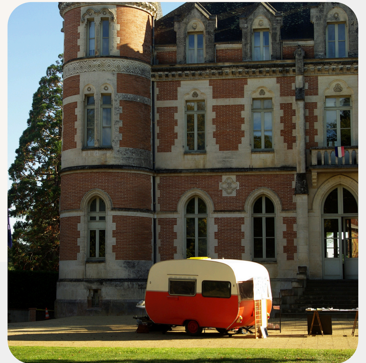
Présentation du dispositif de la Fabrique Argentique au Château de Montauriol, Conseil général de Tarn-et-Garonne, Montauban. Octobre 2025

Inaugurée en octobre 2025, la caravane poursuit sa route, au croisement de la création, de la transmission et de la rencontre.