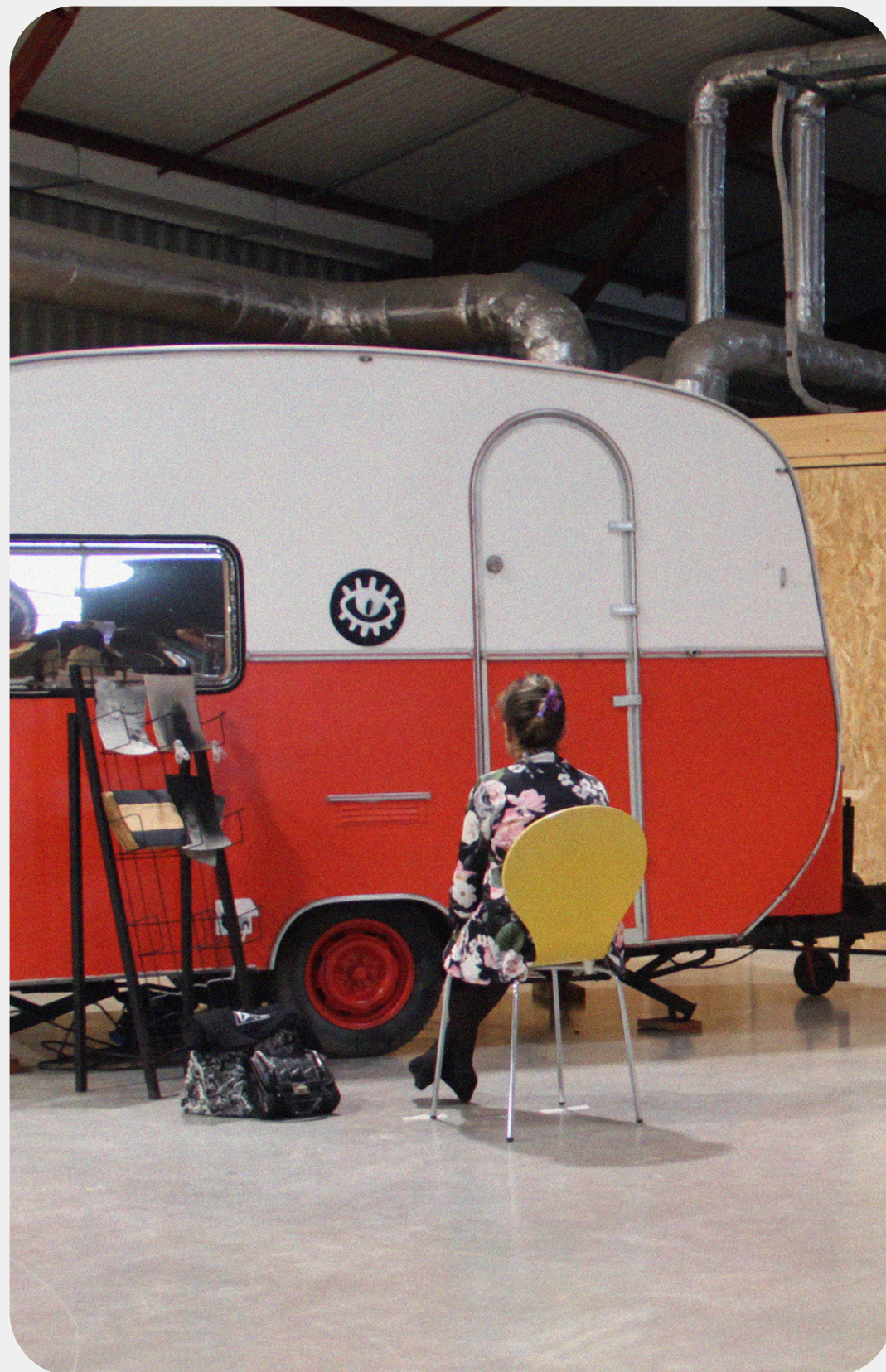
Inauguration de la Fabrique Argentique - portes ouvertes du FabLab La Fabrique, Caylus - Octobre 2025